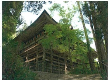
↑清水寺と同じ作りの舞台造り本堂↑