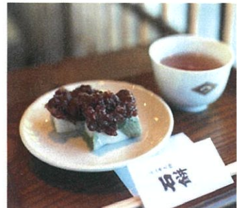
ここでしか食べることができない石餅♡