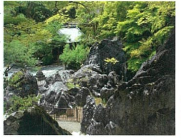
↑国天然記念物の唼灰石↑