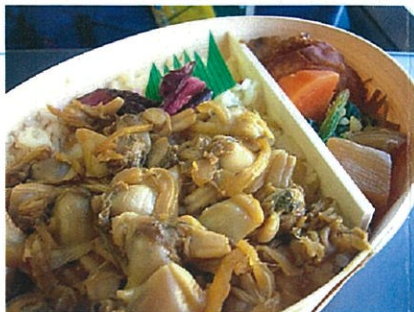
千葉のあさり弁当が美味しい!!