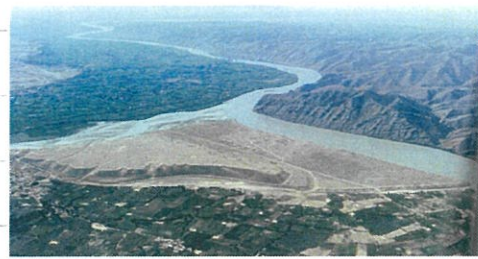
↑2000年のアイ・ハナムの風景↑