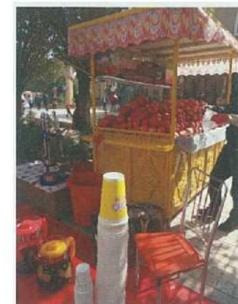
ザクロジュース売場