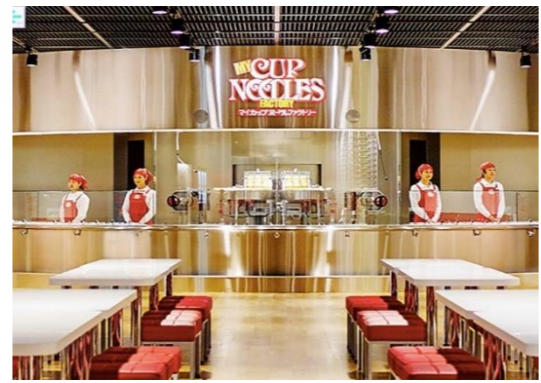
カップヌードルミュージアム 大阪池田