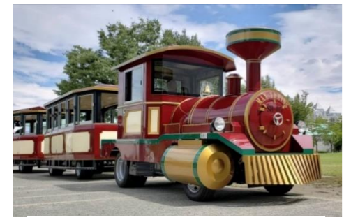
大阪城 ロードトレイン