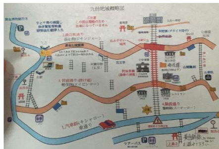
↑ 九份 ↓