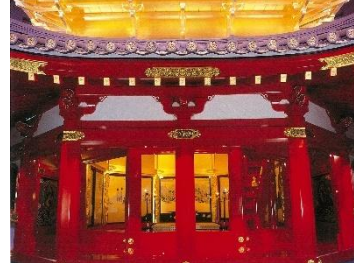
復元された安土城天主五・六階部分